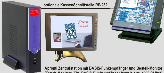
Apronti Zentralstation mit BASIS-Funkempfänger und Bestell-Monitor (Touch-Monitor). Ein BASIS-Funkempfänger kann bis zu 4092 CLiKS Funktastaturen gleichzeitig managen.